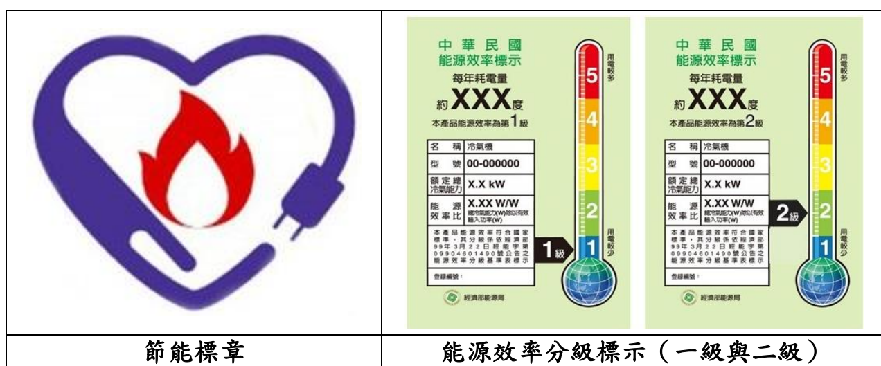
圖1 節能標章及能源效率分級標示